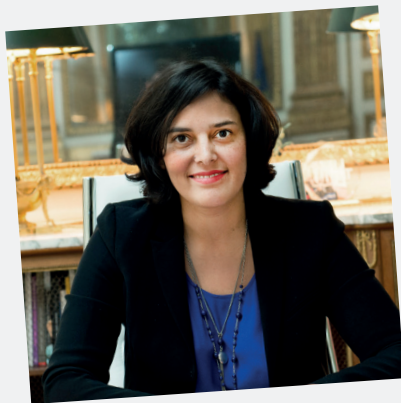
MYRIAM EL KHOMRI MINISTRE DU TRAVAIL, DE L'EMPLOI, DE LA FORMATION PROFESSIONNELLE ET DU DIALOGUE SOCIAL